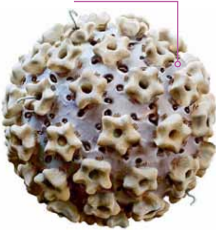
ویروس پاپیلوم انسانی

شناخت عوامل عفونی و توجه به نکات بهداشتی، یکی از بهترین روش های پیشگیری از سرطان است. حال بیابید نگاهی به روش های اختصاصی پیشگیری و درمان این عفونت ها داشته باشیم: